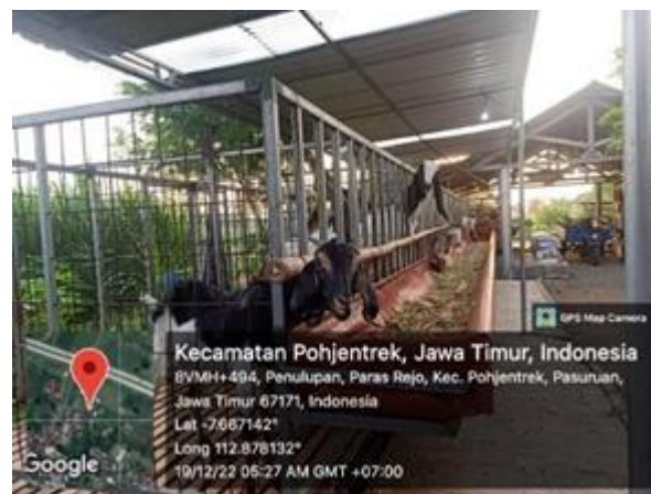
Gambar 3.3 Peternakan BRR Farm

Melakukan studi kasus yaitu kegiatan pengamatan secara langsung dilokasi penelitian terhadap objek yang akan diteliti. Untuk mendapatkan informasi secara akurat maka peneliti melakukan pengamatan di daerah Peternakan BRR farm yang berada di Dusun Paras Rejo Desa Paras Rejo Kecamatan Pohjentrek. Berdasarkan pengamatan secara visual di peternakan BRR farm yang berada di wilayah Dusun Paras Rejo, kandang berada ditengah +- 860 meter.