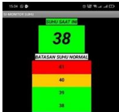
Gambar 4.32 suhu normal