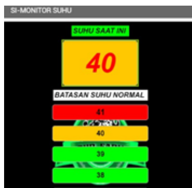
Gambar 4.34 Level siaga