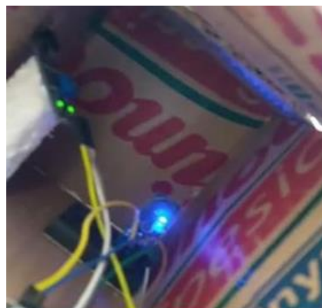
Gambar 4.36 Lampu menyala pada level waspada

Dalam pengujian lampu LED dan buzzer akan menyala apabila sudah mencapai suhu pada level waspada yang telah diatur sebelumnya. Seperti yang ditunjukkan pada gambar berikut: