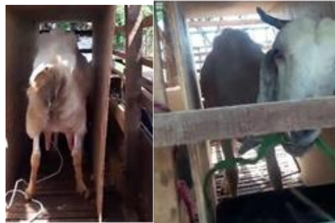
Gambar 4.31 uji coba sensor infrared terhadap suhu kambing.

terbaca nilai suhu yang ditampilkan di aplikasi monitoring suhu kambing. Penulis telah menentukan batas ketinggian suhu berdasarkan level ketinggian suhu pada alat simulasi seperti yang ditunjukkan pada tabel dan gambar berikut.