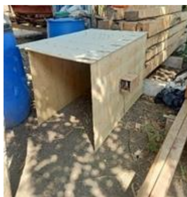
Gambar 4.31 Gambar Prototype Box

Penelitian ini menggunakan alat simulasi berupa kotak dari kayu triplek berukuran lebar 85 cm dan tinggi 85 cm dengan Panjang 120 cm sebagai tempat yang akan dibaca menggunakan sensor infrared.