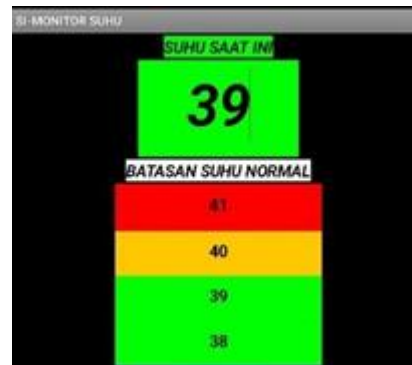
Gambar 4.33 suhu normal